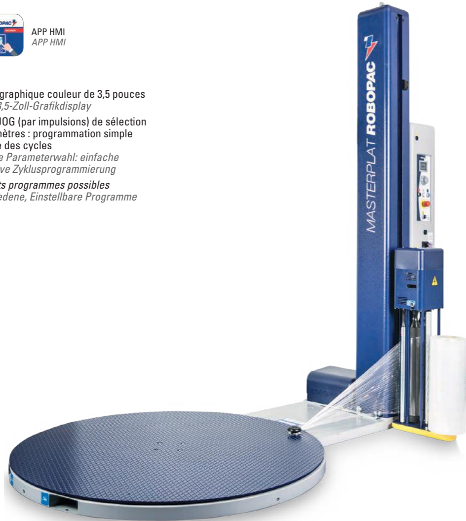
LAYOUT MASTERPLAT PLUS PGS [mm]